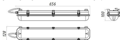
Рисунок 1 Светильник «L-sub 45»

1.5 Общий вид и габаритные размеры светильника показаны на рисунке 1.